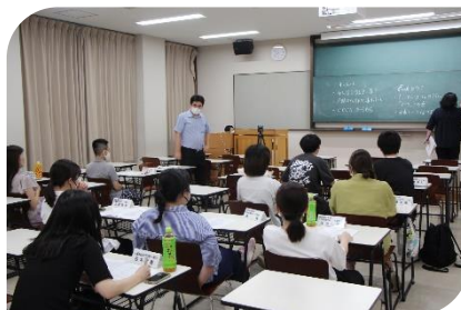
社会福祉系実行委員