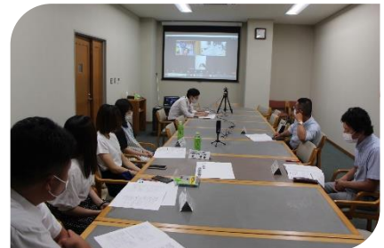
リハビリテーション系実行委員