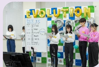
▲ 聖灯祭 2021 の様子

今年の聖灯祭は対面になる。 コロナが落ち着きつつあり、 生活がオンラインからオフラインになる。 コロナの生活から抜け出し、またいつも通りの生活が再び始まる！ いつも通りの生活を充実させたものにするために！ 最高のスタートを切ろう！