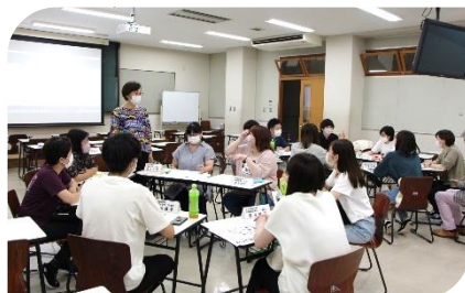
社会福祉系実行委員