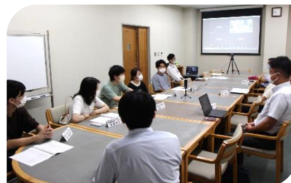
リハビリテーション系実行委員