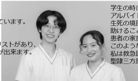
聖隷クリスティー大(2023年卒) C3病棟

聖隷三方原病院には 大学の頃からの友人が多く働いています。 研修や病院内ですれ違う時に、 元気をもらえる存在です。 また、1年生は技術のチェックリストがあり、 ひとつずつ技術を習得することが出来ます。 みなさんと一緒に働ける日を 楽しみにしています。