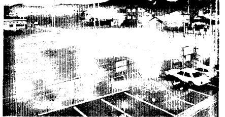
新設されたテニスコート