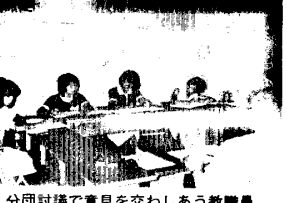
分団討議で意見を交わしあう教職員

その進め方が話し合われたが、テ ーマに対する問題のとりえ方とし て、聖隷学園が聖隷事業集団へ人 材を送りつけてきたその使命感 をもう一度見直すこと、聖隷高校 を衛生看護科から普通科に変更し 基礎学力の養成を目指す当時と 情勢がまったく違ってしまったこ ととその延長線上にある低学衛生 分団討議では委員の意見が述べ られ、各分団としての結論ないし は討議の結果が発表されたのであ るが、全体としての結論を把握す ることは到底私的及びどこでは ない。