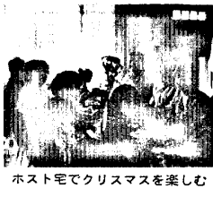
ホスト家でクリスマスを楽しむ

ぼくが一年間滞在したキャマスという町は人口わずか六千といふ田舎町だ。アメリカの田舎は日本のそれと違い、道路の舗装や娯楽施設など生活環境がよく整備されており、とても住みやすい所だ。それと同時に自然環境もたいへん恵まれていて、町全体に緑が生い茂り、公害などはなく、町のすぐ南にはコロラド川が流れているので、そのほとりへ行くとビクニックを楽しむことができた。ぼくは、そのアメリカのもつ大自然の中で一年間高校生活を送ったわけだ。