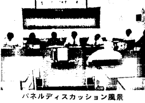
パネルディスカッション風景

「聖隷学園」の 「聖隷教育」とは 夏の研究会の準備をした中で、 テーマを何にするかに議論をつく したが、なかなか適切なテーマが 出てこず苦心した。結局、聖隷学 園の一貫教育について考える、と いうことになったのだが、これが またいま一つどんなことを発言し ていいかわからないということ で随分もめた。