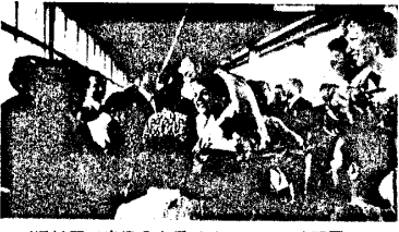
(浜松駅で出迎えを受けるキャマス訪問団)