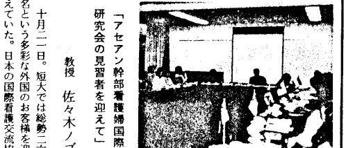
「アセアン幹部看護婦国際研究会の見習者を迎えて」