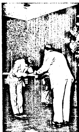
高校新校舎 献堂式