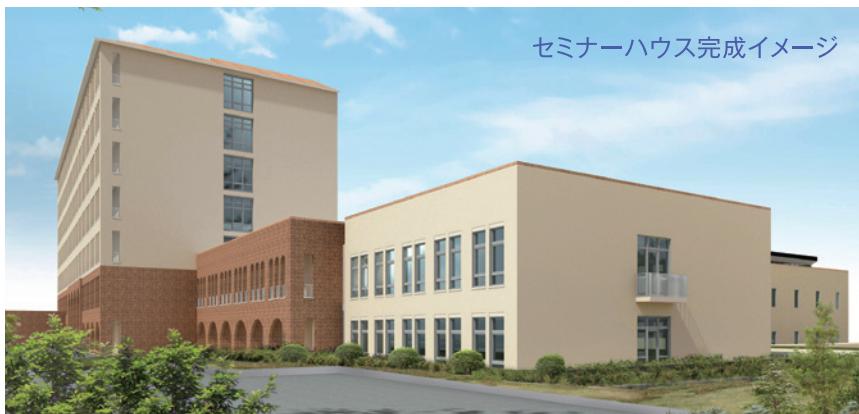
セミナーハウス完成イメージ

中学生・高校生の勉強合宿の場所として使用します。以前は学校外の施設で合宿を行っていました。今後はセミナーハウスを使用することにより、時間的にも経済的にも余裕を持って、より効果的な指導を行うことができます。また、生徒と教員の進路面接の場所としても使用し、指導を一層充実させることが可能となります。