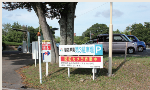
▲学生用に増設した駐車場(72台)