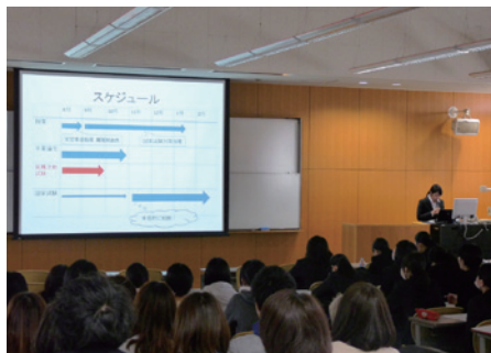
▲4年次生による就職活動報告会(在学生対象)