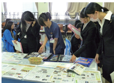
▲病院説明会の様子(在学生対象)

昨年度卒業生・修了生の就職率(※)は99.7%です。看護学部は、看護師が136名、保健師が7名、養護教諭が1名でした。進学者の内10名が本学の助産学専攻科です。社会福祉学科では、浜松市に採用された1名をはじめ4名が精神保健福祉士として就職し、8名が医療ソーシャルワーカーとして就職しました。こども教育福祉学科は、21名が保育教諭・幼稚園教諭・保育士になりました。就職先の詳細については、大学ホームページに掲載しています。