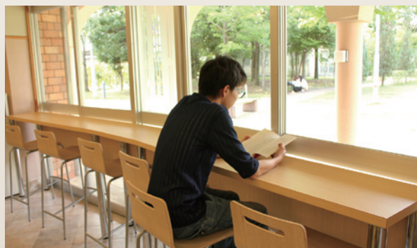
▲学生ホールの混雑緩和のために増設したカウンター席(21席)