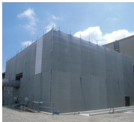
▲セミナーハウス建築中の現在の様子