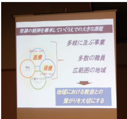
▲昨年度第6回信徒交流会で行われた法人報告の様子