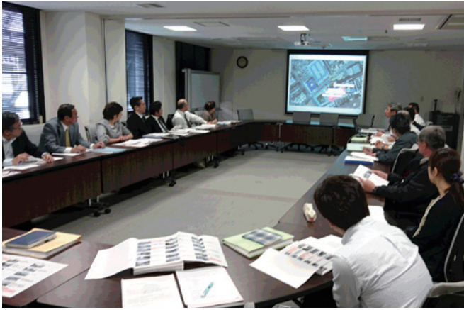
▲三方原サミットの様子(聖隷三方原病院会議室にて)

『三方原サミット』とは、聖隷グループ発祥の地である三方原地区聖隷関係の20以上の教育・保健・医療・福祉施設の代表者・関係者が一堂に会して、防災、安全、研修、広報等の共通する課題について連携・協力関係を図っていくことを目的に設置されました。毎年度テーマを決めた話し合いをこれまで6回実施してきました。2014年から2015年度にかけ「防災」をテーマに話し合いが行われ、災害時は、多くの高齢の方や障害をもつ方が入居し生活されている近隣の福祉・医療施設への支援が必要となるこ