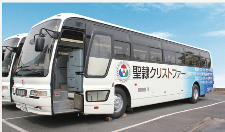
▲本年4月より運行が開始した大学のスクールバス

調査結果は、理事・執行役員、教職員がそれぞれの立場で分析し、その重要度や緊急性を判断して、教育内容の充実、施設設備の充実等に反映しています。大学では、学食の混雑緩和に向けて、これまでも2号館 2階の学生ホールおよび5号館2階の学生ラウンジを新設するなど少しずつ充実に図ってきましたが、それでもなお、食事をとるスペースの拡張を希望する声は高まっていますので、座席数の増設について検討を進めていきます。通学では、本年4月からJR浜松駅と本学直通スクールバスの運行を開始しました。また、10月には新たに90台程度の学生用駐車場を増設し、利便性を向上させていく計画です。学内のIT環境は、パソコン教室1室はいつでも使用できるよう改善を図りつつ、個人所有のパソコンやタブレットが自由にいつでも使えるよう、Wi-Fi環境を充実させていく計画を推進しています。中・高等学校においても、セミナーハウスの新築など教育環境の改善・整備を図りつつ、生徒からの要望や意見を真摯に受け止め、生徒の声を学校運営の重要な尺度と捉えて改革を推し進めたいと考えています。最後に、調査に協力を頂いた学生・生徒の皆さんに感謝を申し上げます。